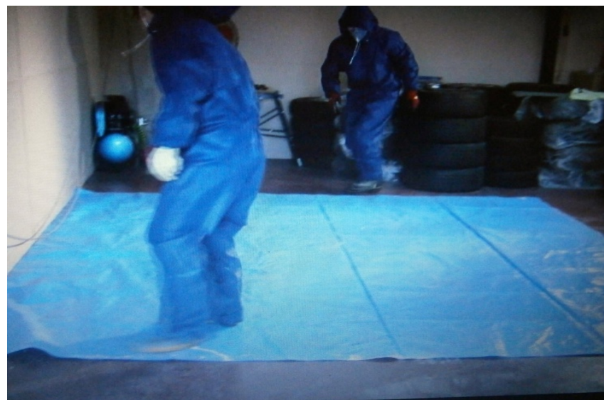
④遮蔽検査開始準備