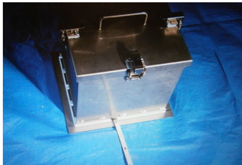
②試作機から距離を測って測定(10cm毎)