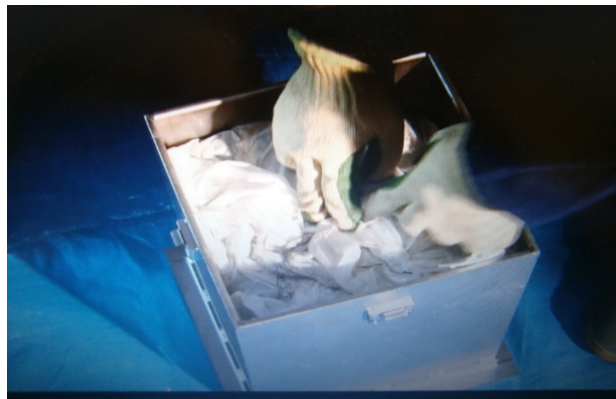
②検査対象物の試作機への投入