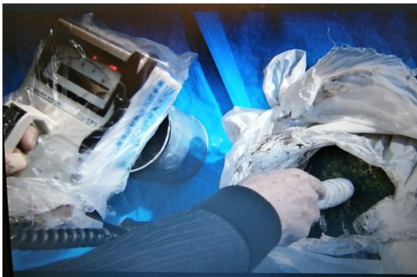
①検査対象物のみの放射線測定