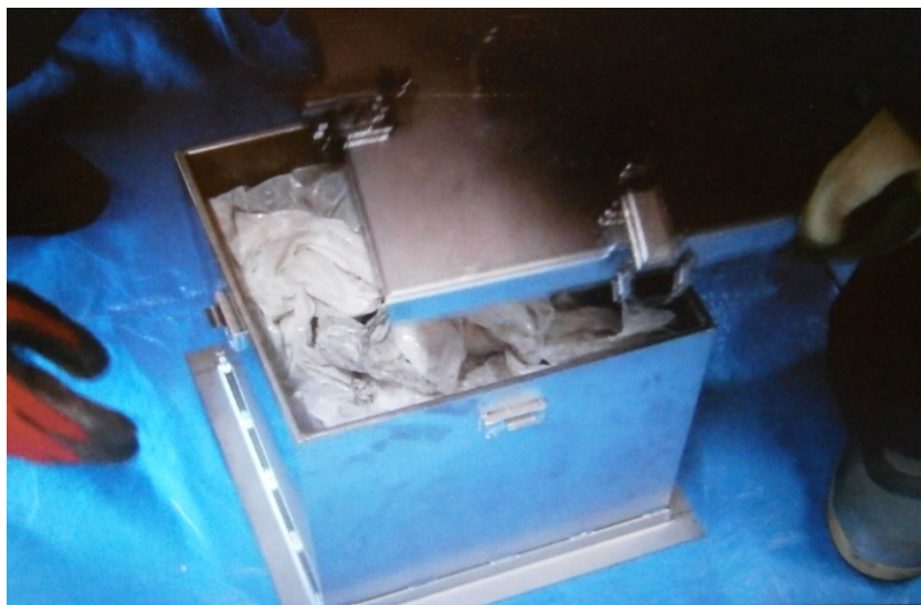
③投入後、蓋を閉める